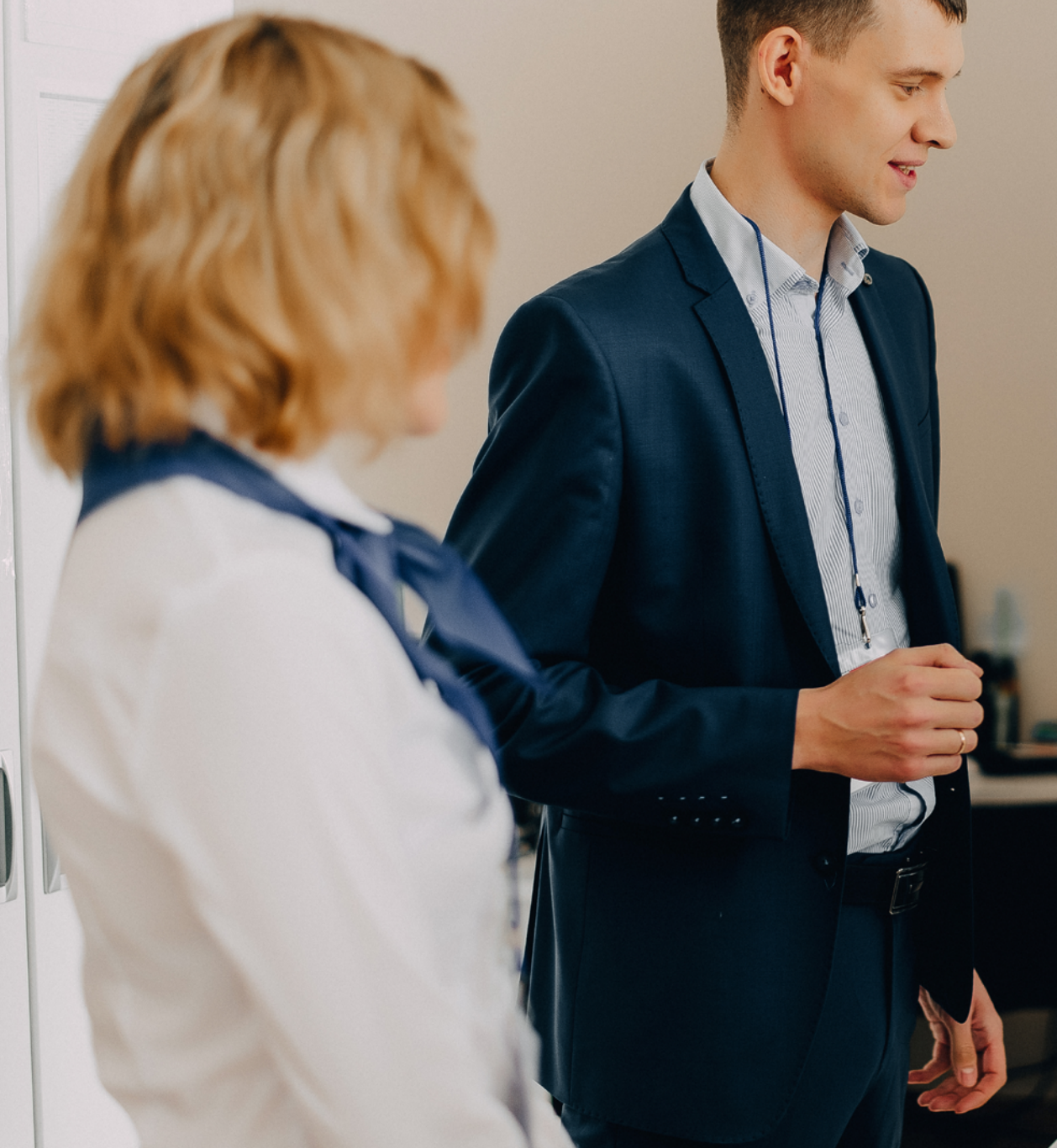
ГРАФИК ДЕЖУРСТВ 21.04